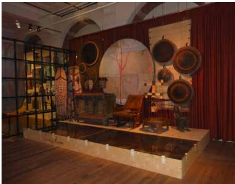
Eén van de negen kamers: Living Room

Daar waar de poster op straat nep en kitscherig oogt is de tentoonstelling zelf echt en beziel. Daar waar enige relativering in zijn toon, keuze en verhalen van Jasper Krabbé ten enenmale ontbreekt laat de tentoonstelling 'Soulmade' juist bescheidenheid, twijfel en diversiteit van interpretaties zien. T/m 25 januari is het werk van Jasper Krabbé te zien in het Tropenmuseum te midden van vele onbekende kunstwerken uit het verleden en uit verre landen.