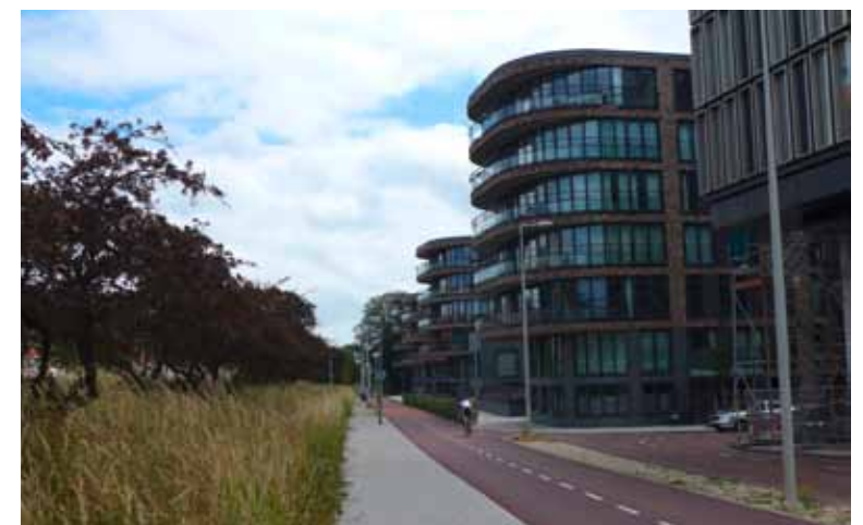
De opvallende ronde gevels van de Heelmeesters kan geen fietser ontgaan.

als 'de straten waar je verloren voorwerpen af kon halen'. Boerderij De Eenhoorn is hier het enige gebouw dat de eeuwen heeft doorstaan. Rond het Kraaipan schoolgebouw zijn altijd gezinswoningen geweest voor de vele kinderen, die hier naar school gingen. In het dubbele gebouw uit de dertiger jaren, waren eerst de openbare Louis Botha school en de Joodse Talmud Toraschool gehuisvest. In de oorlog nam Joodse school nummer 9 de plek in van