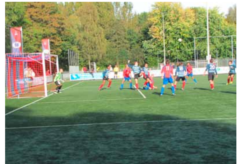
JOSWGM met rode shirts en blauwe broekjes en kousen in de aanval.

Ook vertelt hij over de begeleiding van de jeugdelftallen. Als een speler zich misdraagt krijgt hij een waarschuwing, bij de tweede keer worden ook de ouders uitgenodigd voor een gesprek en bij de derde keer wordt er afscheid genomen van de betrokken voetballer. Ook vindt hij het een goede zaak dat clubmensen elkaar met humor attenderen op bijvoorbeeld het feit dat er binnen ook een toilet is. Hij vindt het ook heel gezond dat de KNVB na de dood van de grensrechter van Buitenboys in 2012 initiatieven heeft genomen om het informele netwerk van amateurclubs te versterken. Als er nu een incident plaats vindt, dan is de drempel heel laag om een voorzitter van een andere club te bellen en eventuele