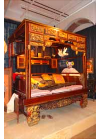
Een deel van de Bed Room

Een maand later loop ik op een zonnige vrijdagmiddag nogmaals door de negen 'kamers'. Een enkele passant tref ik, en een enkele suppoost: veel bekijks lijkt de tentoonstelling (nog) niet te krijgen. Net als de eerste keer ben ik onder de indruk van de sfeer die is gecreëerd. En net als de eerste keer wordt mijn aandacht niet