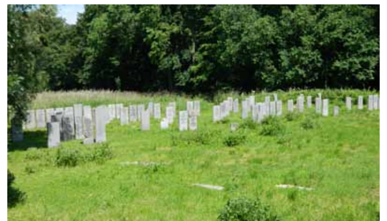
Een honderdtal graven is in ere hersteld.

De in 2002 overleden schrijver/journalist Boudewijn Büch schreef in Het Parool van 18 juni 1982 het volgende: 'Op een zomerse dag loop ik vanuit het eigenlijke Flevopark door een stenen poort Zeeburg op. Deze mooie poort is niet de oude ingang van het kerkhof. Het zogenaamde 'Hekkepoortje' stond tot 1898 aan de opgang van de brug die over de tegenwoordige Singelgracht ligt. Het poortje werd in 1938 herbouwd op de plaats waar het nu staat. De 'voormalige Israëlitische Begraafplaats Zeeburg' bestaat tegenwoordig uit drie delen waar openstaande smeedijzeren hekken naar toe leiden. Het is warm als ik door het hoge gras loop. Overal liggen mensen, soms op oude zerken, de zon te aanbidden. Er wordt zelden of nooit gemaaid op Zeeburg; het zou ook nauwelijks kunnen want de maaimachine of zeis zou stukslaan op de duizenden stenen en steenbrokken die overal in het gras – op moerassige plekken zelfs in het riet – liggen.' Dit artikel vormde de aan-