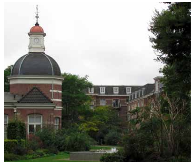
Blij met dit uitzicht