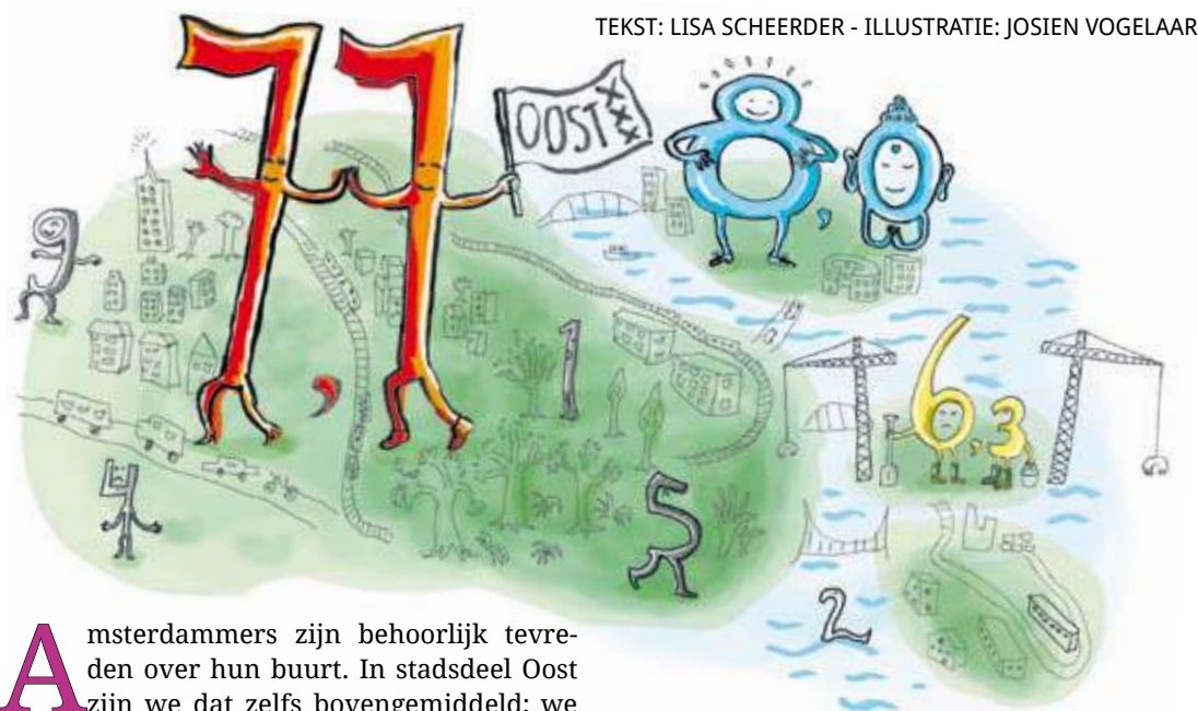
TEKST: LISA SCHEERDER - ILLUSTRATIE: JOSIEN VOGELAAR

Af en toe is het fijn om de complexiteit van het leven te doorgronden met behulp van cijfers. Eenvoudige cijfers: tussen nul en tien. Gelukkig zijn wij als hoofdstadbewoner onderdeel van de vele lijstjes die over haast ontelbare onderwerpen worden opgesteld. Als liefhebber daarvan begint de IJopener een serie over onze buurt in cijfers. In deze aflevering het eerste deel: hoe tevreden zijn wij over onze buurt?