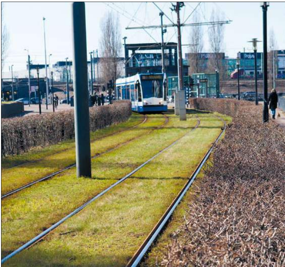
Gras tussen de rails van tramlijn 10 voor tijdelijke opvang van regenwater