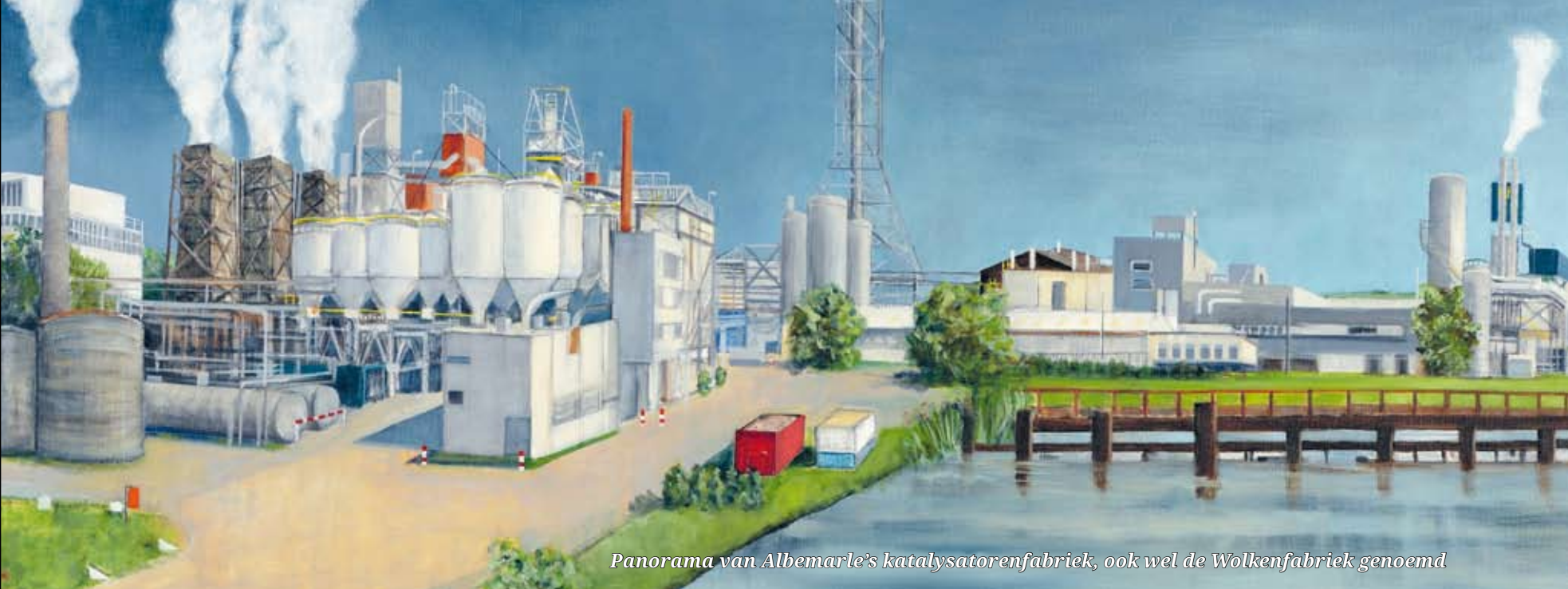
Panorama van Albemarle's katalysatorenfabriek, ook wel de Wolkenfabriek genoemd

den moeten blijven. Wat de Zamenhofstraat betreft, moeten de historische gebouwen blijven en natuurlijk de scheepshelling van Verschuren. Daar kunnen theatervoorstellingen en openluchtconcerten gehouden worden.'