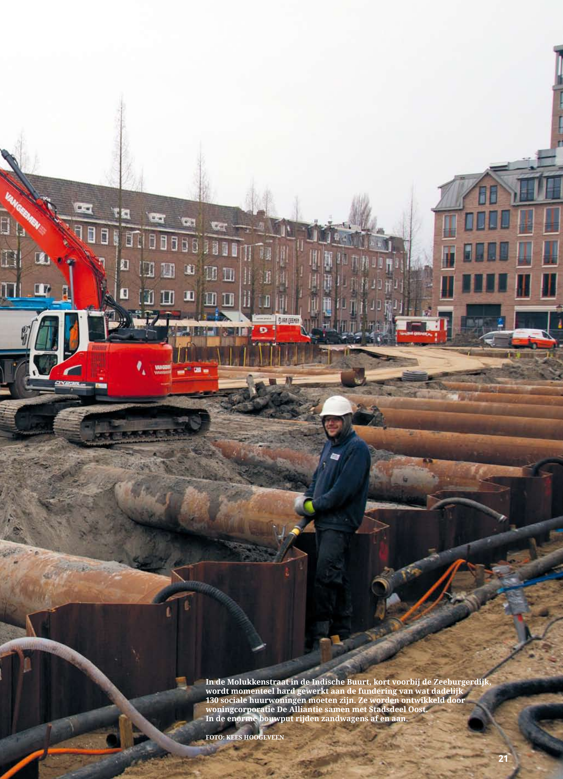
In de Molukkenstraat in de Indische Buurt, kort voorbij de Zeeburgerdijk, wordt momenteel hard gewerkt aan de fundering van wat dadelijk 130 sociale huurwoningen moeten zijn. Ze worden ontwikkeld door woningcorporatie De Alliantie samen met Stadsdeel Oost. In de enorme bouwput rijden zandwagens af en aan.