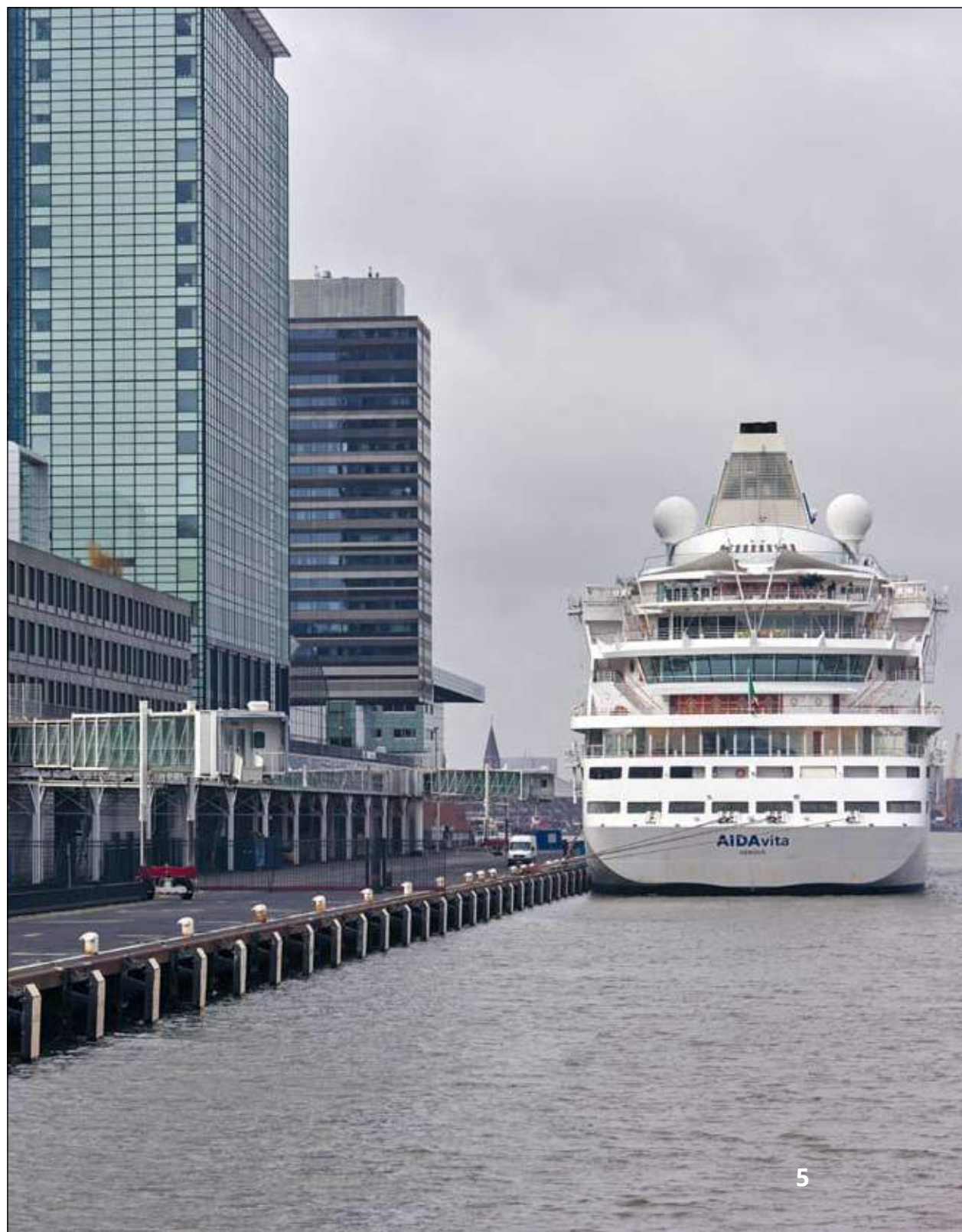
Cruiseschip aan de Veemkade

Het mooie van Conrads verhaal zit ‘m in zijn waarnemingen van maritiem Amsterdam, van het winterse Oostelijk Havengebied, van mensen en vaar- en voertuigen – een paardentram! – uit lang vervlogen tijd. We worden ons ervan bewust dat de Handelskade en omgeving er ooit heel anders hebben uitgezien; dat hier twee-, drie- en viermasters soms moeizaam hebben liggen laden en lossen. Het valt te hopen dat een hedendaags auteur nog eens de laatste resten van de grote scheepvaart in het Oostelijk Havengebied pakkend weet te beschrijven. Daarom zou het jammer zijn als cruiseschepen zoals de Magellan van de Veemkade moeten verdwijnen, wat de gemeente wil. Hou die boten hier, geef de nieuwe Conrad een kans. <