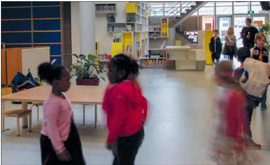
De nieuwe inrichting van de centrale hal

In 2016 kreeg de 8e Montessorischool Zeeburg aan de Borneokade het predicaat 'zwak' in het rapport van de onderwijsinspectie. Inmiddels is de school verbouwd en werkt de nieuwe directrice samen met het team aan verbetering van het onderwijs en de sfeer op school. Blijft het negatieve rapport nog aan de school plakken? Tijd voor een update.