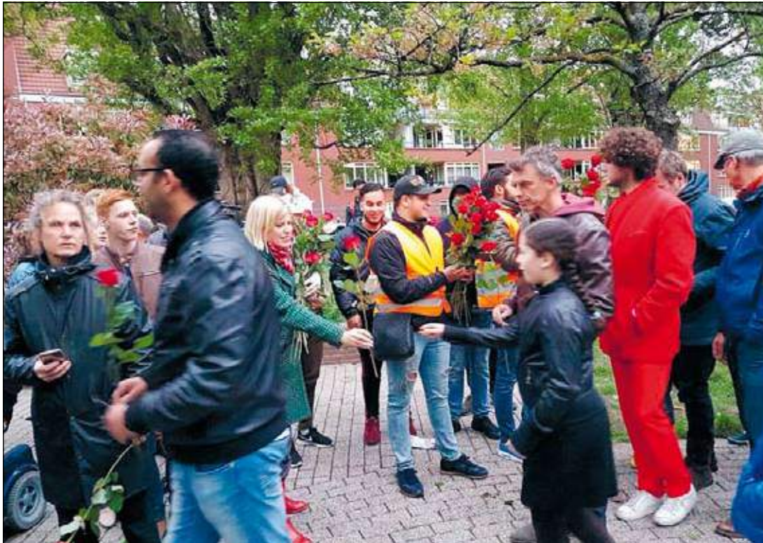
Herdenking op het Ceramplein in de Indische Buurt

TEKST: HANSJE GALESLOOT - FOTO'S: NEDERLANDS FOTOMUSEUM EN STICHTING DE HOOP