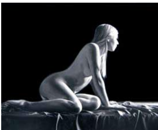
Leeuwin, zwart-wit schildering acrylverf 80/100 cm