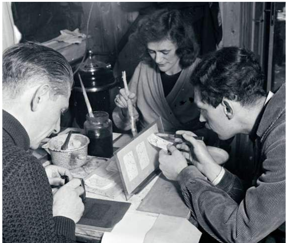
Bevriende kunstenaars bezig met het vervalsen van identiteitsbewijzen in de Tweede Wereldoorlog

betekenis van het gebouw voor joodse vluchtelingen, met de mogelijkheid de tentoonstelling te bezoeken.