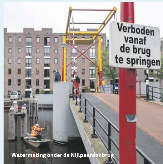
Watermeting onder de Nijlpaardenbrug

Honden- en vogelpoep kan in het water terechtkomen door afspoelend regenwater. Menselijke poep komt in het water als het riool overloopt. Dat gebeurt 5-10 keer per jaar na een zware bui, als er meer regen is gevallen dan het riool kan afvoeren. Dat overlopen gebeurt bij zogeheten overstorten: buizen die onder water verdund rioolwater lozen. In onze buurt zijn dat er een stuk of twintig, waarvan twee onder de Nijlpaardenbrug, gelegen tussen twee