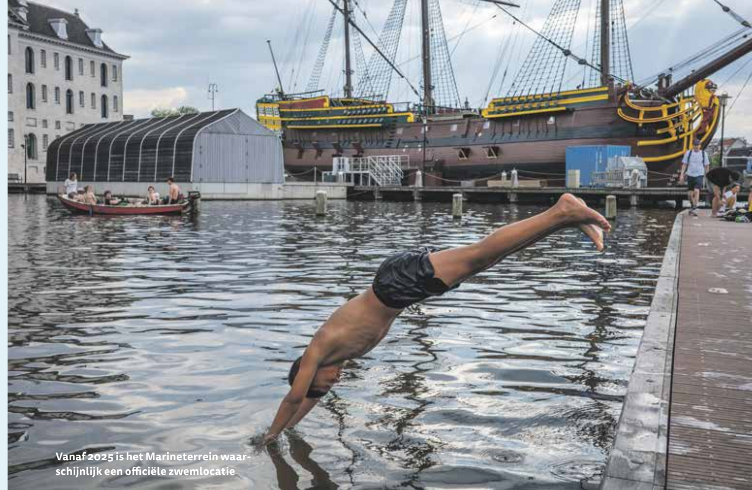
Vanaf 2025 is het Marineterrein waarschijnlijk een officiële zwemlocatie

zwemsteigers. Het duurt een dag of drie voordat het water na zo'n bui weer helemaal schoon is. Zwem je al eerder in het tijdelijk vervuilde water, dan is er een kans op acute misselijkheid, braken of diarree. Ook al is de kans dat deze bacteriën in het water zitten dus klein, uit voorzorg is het toch verstandig om geen water in te slikken. Om zulke gezondheidsrisico's te voorkomen is de City Swim van 2018 afgelast en had de editie van 2015 ook afgelast moeten worden. Beide keren had het vlak voor de start hard geregend. De startplek zelf, het Marineterrein, krijgt naar verwachting in 2025 de status van officiële zwemlocatie. Ook nu al is de beheerder alert. Stort er een riool over of valt er meer dan 12 mm neerslag in een uur, dan geeft hij een zwemwaterwaarschuwing.