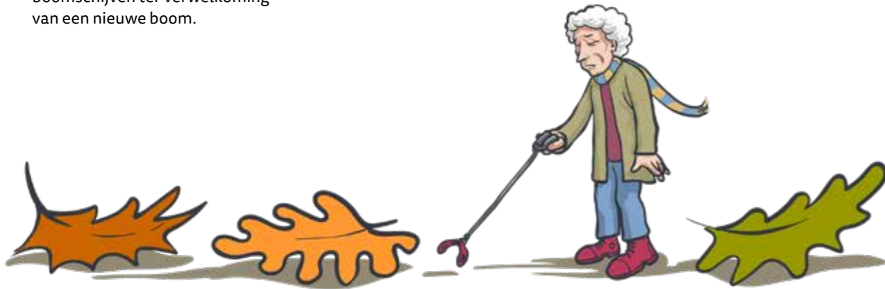
ILLUSTRATIE: ERIK VAN OPHEM

Ik kom elke dag woorden tegen die ik niet ken of nog nooit gehoord heb, laat staan dat ik ze begrijp. Vooral de reclamewereld weet er een potje van te maken. Koplopers om ons met woorden te verleiden zijn de schoonheidsartikelen. Voor elk nieuw artikel worden de mooiste, raadselachtigste en zelfs hoopvolle woorden bedacht. Zoals bijvoorbeeld 'je zal overal een onvergetelijke indruk achterlaten'. Of dat nu zo gunstig is, is maar de vraag. Van een gezonde wandeling door de Hortus fleurt men toch ook aardig op. 🌿