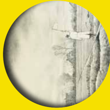
TEKENING: A. NIJENHUIS

Het Museum van de Geest krijgt geen subsidie meer en heeft het moeilijk. En dat terwijl de kunst en de verhalen over kwetsbare mensen zo broodnodig zijn, voor hen, maar ook voor ons.