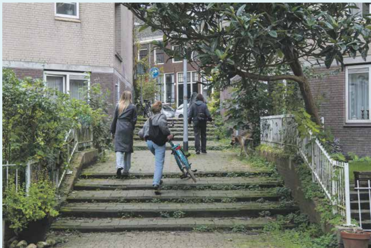
Vanaf de kinderspeelplaats is het enkele meters omhoog naar de Hoogte Kadijk.

Ook in het westelijke deel van de binnenstad liggen zulke waterkeringen, waaronder de Haarlemmerdijk. Maar om het centrum bij hoogwater vanuit zee hermetisch af te sluiten moet er meer gebeuren. Ook de grachten moeten dicht. Om dat voor elkaar te krijgen liggen er langs de noordkant van de stad 14 sluisen, die samen met de waterkeringen het zogeheten 'IJfront' vormen. De meest westelijke sluis is de Haarlemmervaartsluis, de meest oostelijke de Zeeburgersluis. Stijgt het water in het Noordzeekanaal en het IJ, dan gaan deze sluisen dicht en is de binnenstad beschermd. In theorie althans, want soms gebeurt er iets onverwachts, zoals op 2 november 2023. Toen was er namelijk een storing in de sluisen bij IJmuiden.