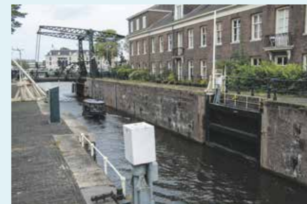
Een klein bootje vaart door de Scharrebijsluis, onderdeel van het IJfront.

Terug naar de evaluaties van de bijna-ramp. De rapporten zijn kritisch over de staat van onderhoud van de sluisen bij