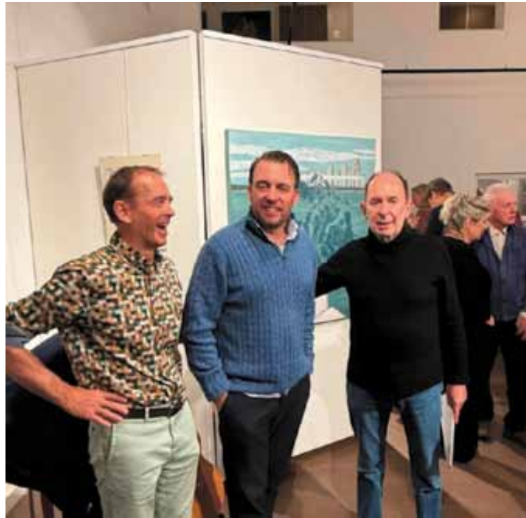
Bij Americana expositie in het Ramses Shaffy Huis

Het Shaffy Huis is maar een voorbeeld van de nieuwe woongemeenschappen die overal in de stad, en zeker ook in Oost, ontstaan. Moderne hofjes, wooncoöperaties en andere woonvormen: ze verschijnen in vele soorten en maten, vooral in de nieuwe wijken. Met zelfstandige woningen, maar dan gecombineerd met gemeenschappelijke faciliteiten. Van hele praktische ruimtes, zoals ruimtes met professionele