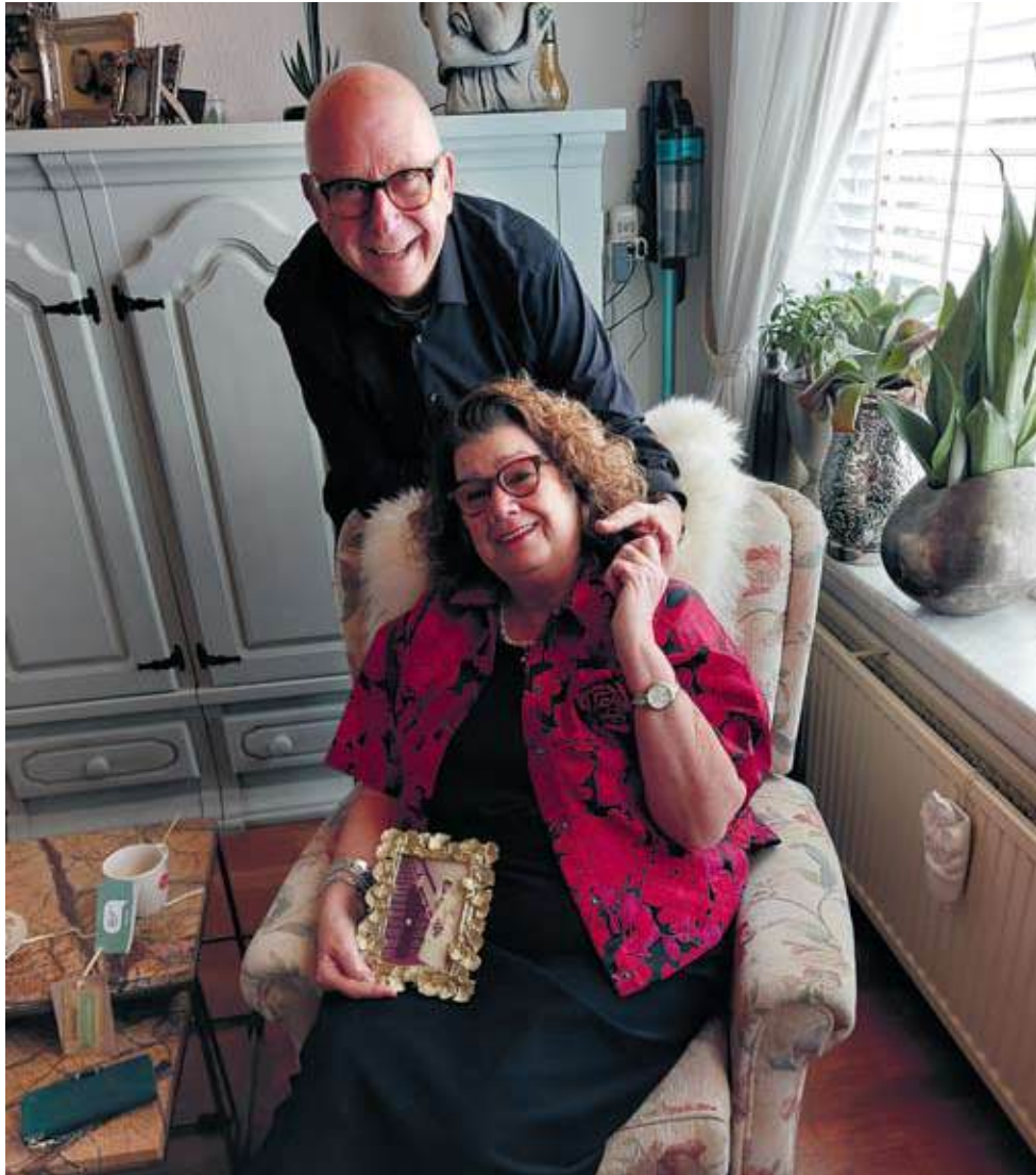
'Heerlijk om met pensioen te zijn'

vrolijke Jehovah's Getuigen trouwden 50 jaar geleden. Met elkaar.