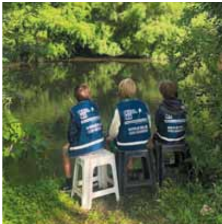
Vaak naar buiten bij 'scouting-bso's'

'Kleinschalig betekent ook dat we buurtgericht zijn. Daarmee is er een grote kans op binding tussen kinderen en ook ouders. Sommige kinderen zijn