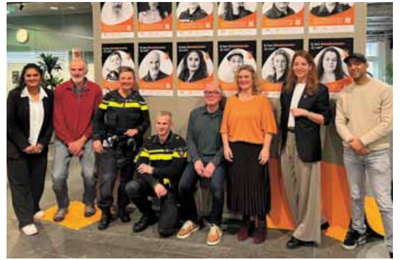
Onthulling postermuur stadsloket Orange the World