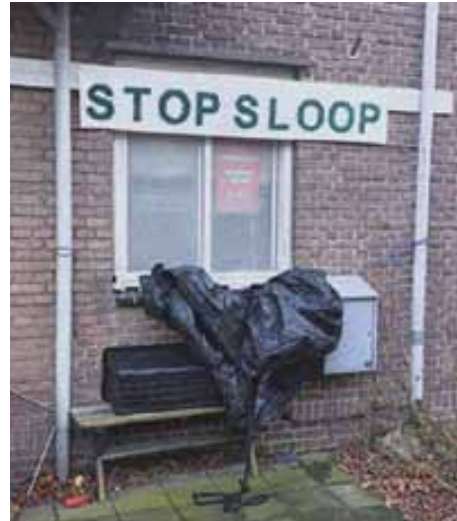
Sloop of renovatie in Amsteldorp

Renovatie en sloop van wooncomplexen zijn ingrijpende processen waarbij bewoners vaak tegengestelde belangen hebben, wat het overleg soms ingewikkeld maakt. Waar de één met plezier woont, wil de ander zo snel mogelijk verhuizen. Natuurlijk zijn er voordelen: een mooi opgeknapt woning (of helemaal nieuw), een verhuiskostenvergoeding van € 7673,-, een stadsvernieuwingsurgentie voor wie weg wil. Maar voor velen weegt dat niet op tegen de nadelen van de on-