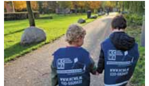
Wandelen in Park Frankendael

Stagiaires en groepsondersteuners zijn extra op een groep. Verder is er een pedagogische coach, zijn er unit-coördinatoren en leidinggevend. Wel is het helaas ook bij ons soms een probleem om aan nieuw personeel te komen. Wat een reden kan zijn dat we onze groepen niet vol kunnen plannen.' En zijn er mannen bij jullie? 'Je vindt bij ons voornamelijk bij de buitenschoolse opvang mannelijke medewerkers en wij denken dat kinderen op alle leeftijden baat hebben bij omgang met vrouwen en mannen.'