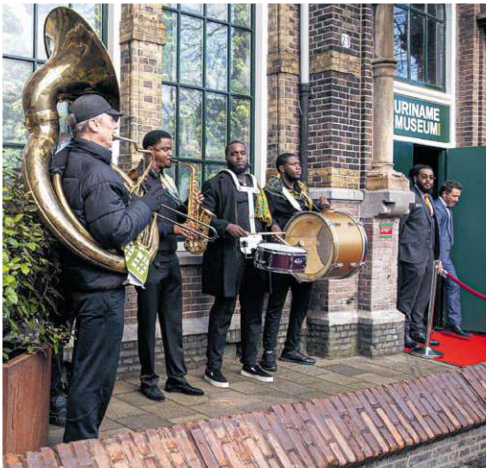
Een muzikaal onthaal bij de ingang van het museum

Koning Willem-Alexander opende op 25 november, precies vijftig jaar na de onafhankelijkheid van de Republiek Suriname, het Suriname Museum aan de Zeeburgerdijk in Amsterdam-Oost.