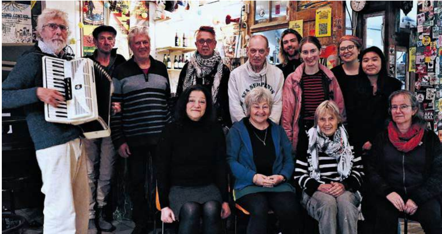
Het koor 'Verzet per couplet' in de gemeenschapsruimte

In november 2015 verwierf een woningbouwvereniging met wortels in de kraakscene een voormalig schoolgebouw in de Dapperbuurt. Tien jaar later staat het collectieve ideaal nog fier overeind in woon-werkgebouw en politiek buurtcentrum NieuwLand.