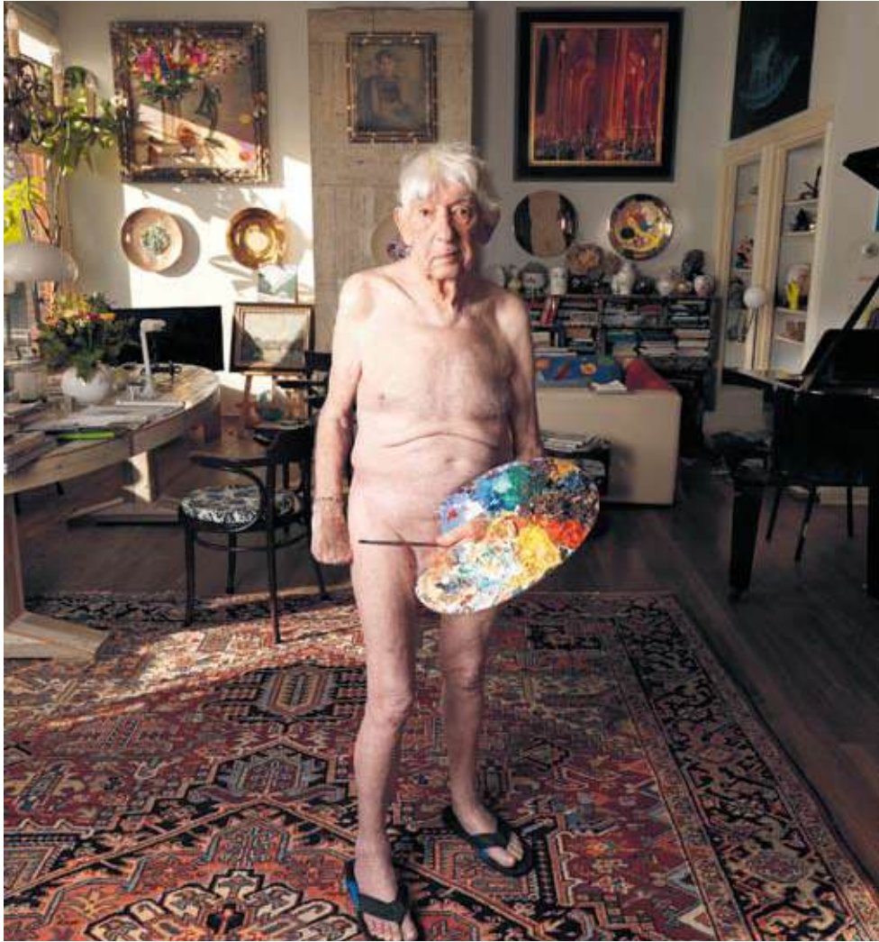
Aat in de woonkamer, naakt, met palet, 2018. © Venus Veldhoen

Leven en dood zijn in Aat Veldhoens werk met elkaar verstrengeld, het meest letterlijk in het schilderij met copulerende skeletten. Tot Zover, het museum op De Nieuwe Ooster, geeft een fascinerend inkijkje in het gedachtegoed van de levenskunstenaar die geobsedeerd was door de dood.