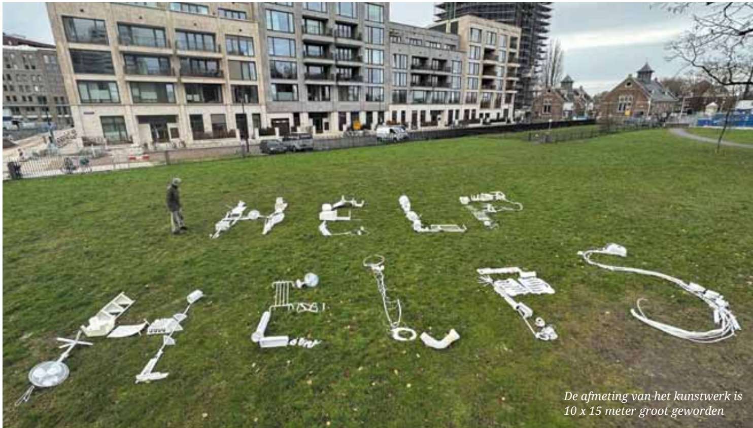
De afmeting van het kunstwerk is 10 x 15 meter groot geworden

Tekst: Jaap Kamerling