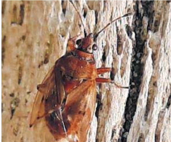
Berkenmalsnuit op berk

M'n moeder vertelde me, het was een van de eerste mooie dagen van het jaar 2000, dat ik de toen nog zeer jonge berk een beetje af moest toppen. Ik meen me te herinneren dat ze zei dat de berk dan sneller hoog zou groeien. Een dergelijk argument in ieder geval.