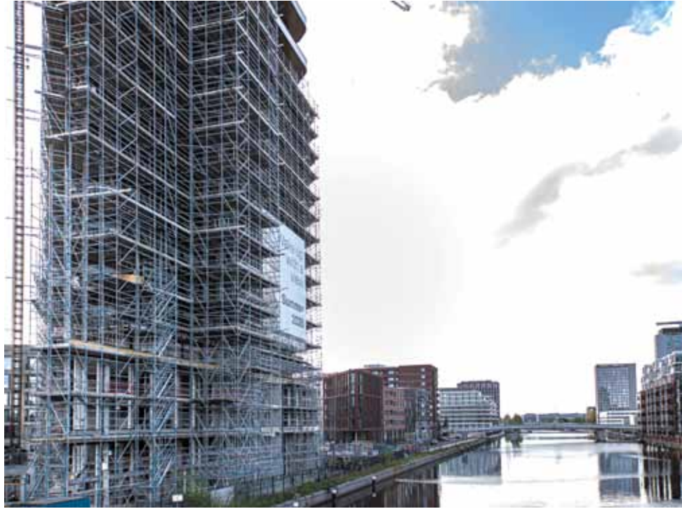
De druk om nieuw te bouwen is hoog

Cijfers bewijzen de nood van enigszins bemiddelde Amsterdamse woningzoekenden. 'De gemiddelde huurprijs van een vrije sectorwoning is ruim