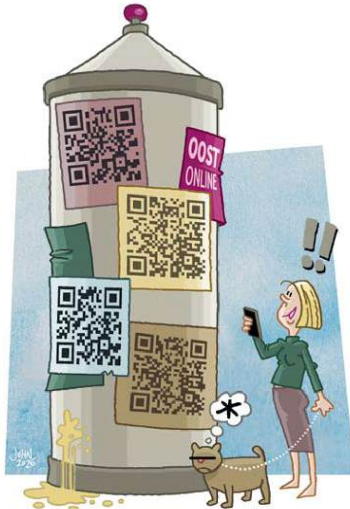
Klik meteen door naar oost-online

Inmiddels kunnen Amsterdammers oost-online goed vinden. "Dit jaar hadden we meer dan 200.000 bezoeken van waarschijnlijk ongeveer 95.000 individuele bezoekers. Er is ook een nieuwsbrief met nu 4500 vaste gebruikers. Wat begon in de Watergraafsmeer, breidde zich uit naar stadsdeel Oost maar ook Centrum-oost. We bedienen in feite het gebied tussen de Amstel en het IJ.