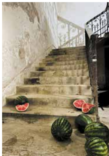
Still from Familiar Phantoms, Larissa Sansour and Søren Lind 2022