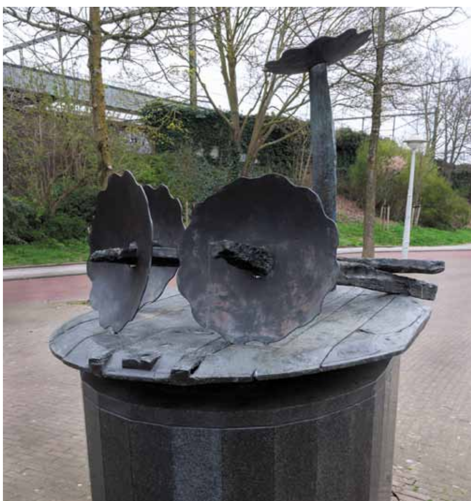
'Flowers' van Karel Appel, bij het Muiderpoortstation

Nadat de groep in 1951 werd opgeheven ging Karel Appel 'solo' verder, hetgeen resulteerde in een enorme hoeveelheid schilderijen, tekeningen, wandschilderingen en sculpturen, die laatste vaak op basis van gevonden voorwerpen. Appels kunst wordt veelal gekenmerkt door heldere kleurvlakken,