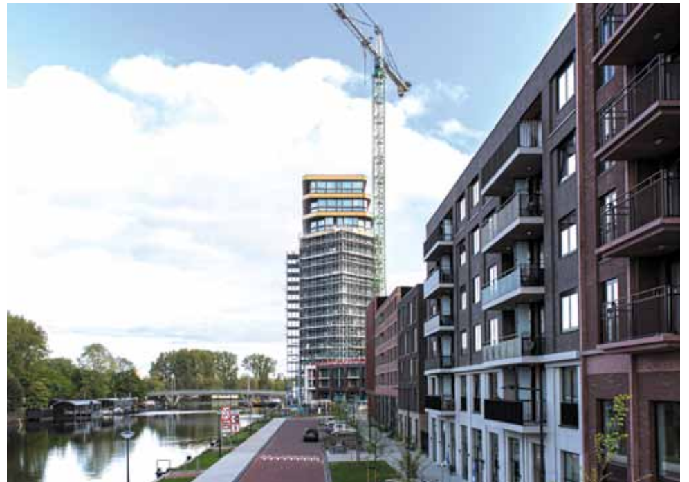
Koopnieuwbouwwoningen zorgen gemiddeld voor twaalf verhuisbewegingen

(liefst wel) in de eigen buurt problematisch. Gemeenschappelijke wooninitiatieven lijken nog het meest haalbaar. Misschien zijn de 'empty-nesters' door de gemeente met creatieve stimulerende ideeën in beweging te krijgen. Als van de genoemde senioren meer